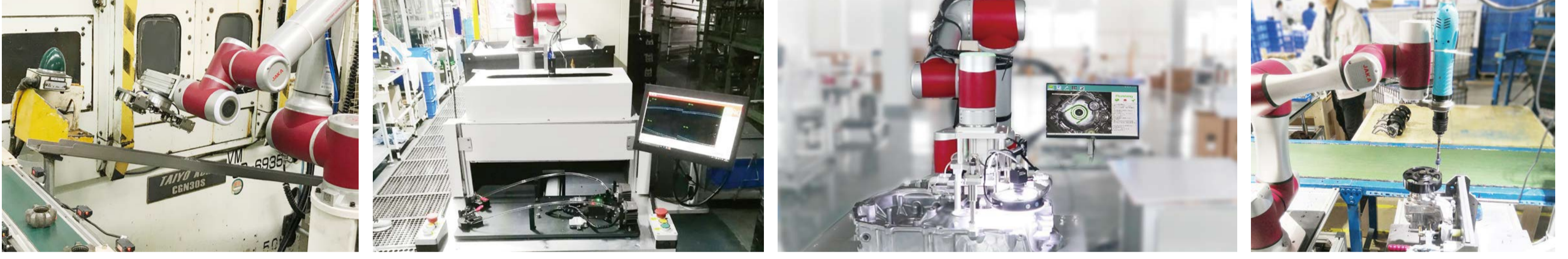
Yükleme & Boşaltma